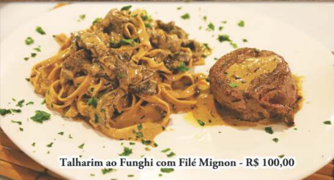
Talharim ao Funghi com Filé Mignon - R$ 100,00