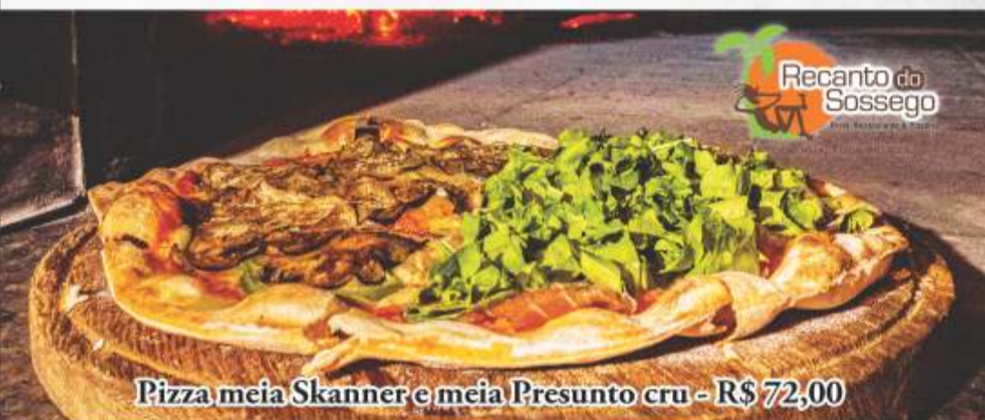
Pizza meia Skanner e meia Presunto cru - R$ 72,00