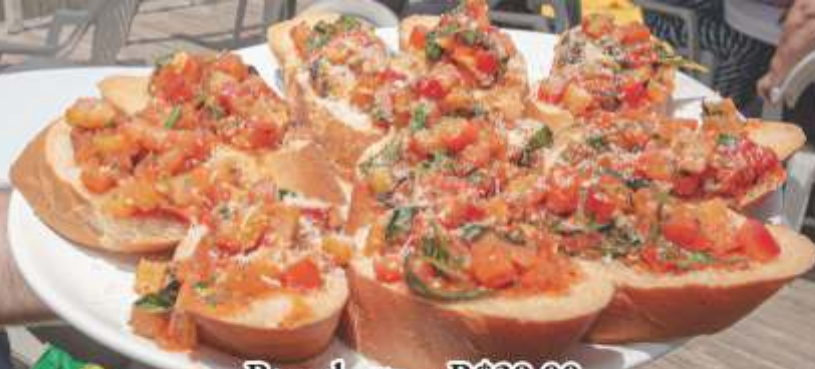
Bruschetta - R$39,00